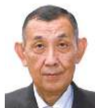
福品 博美 三次RC 2024年10月3日 司法書士