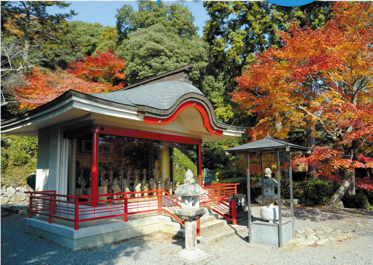
義士堂／鳳源寺 (三次市)