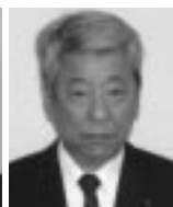
最紙 孝 徳山 R C 2010年8月5日 電気工事