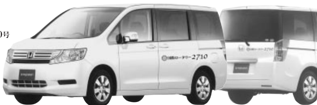
国際ロータリー2710号

ロータリークラブが地域に関わりを持っていることを含め、ロータリークラブを知っていただく機会でもあると、ロータリーの記章と2710地区の文字を転記し、子供たちの教育環境の充実・向上に資する一助として、私達は地区会員の皆様を代表して送迎車両の寄贈をいたしました。