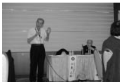
川妻バストガバナー