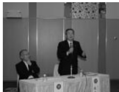
杉谷コーディネーター