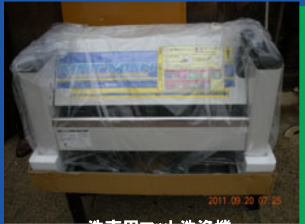
洗車用マット洗浄機

小さな一粒の種ですが地域のお役に立つ一助となり、ロータリーの精神の一部を具現化できたことをクラブ員一同感謝しております。施設からお返しに感謝のメッセージが入ったうちわを頂きました。感動感謝。