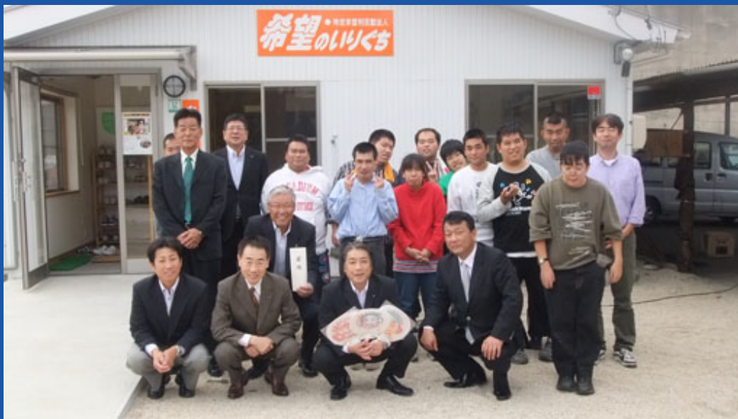
平成23年10月25日授与式を実施 記念撮影