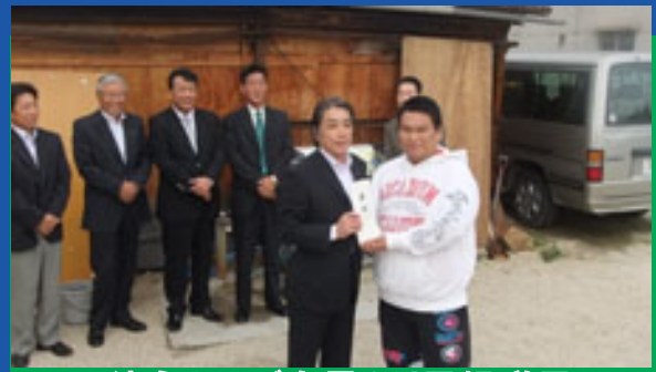
徳永クラブ会長より目録贈呈