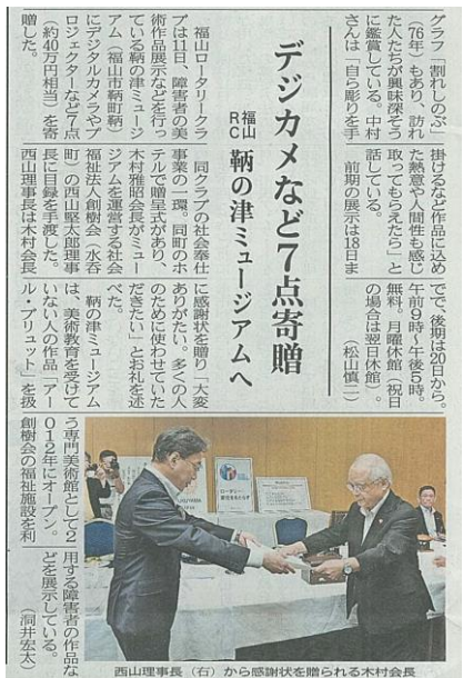
山陽新聞(9月13日)掲載