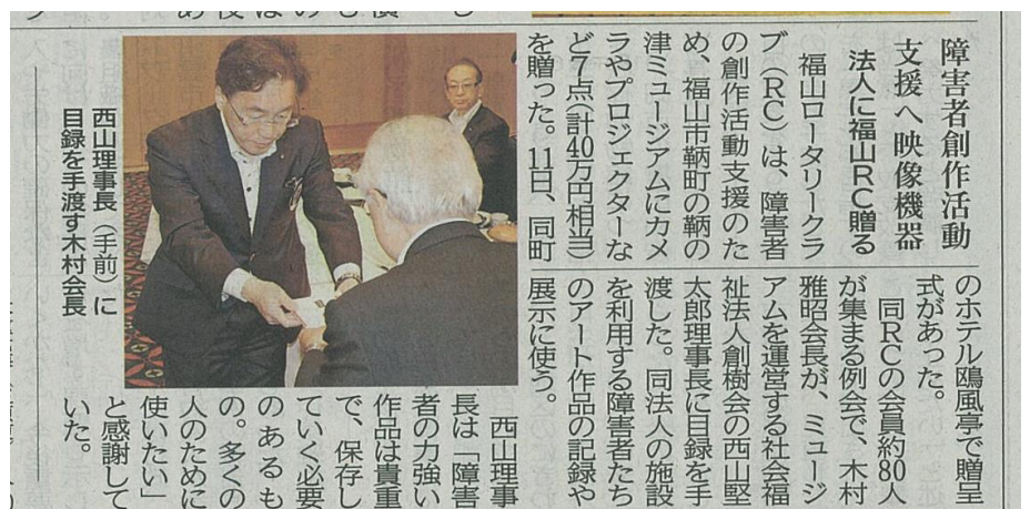
中国新聞(9月12日)掲載