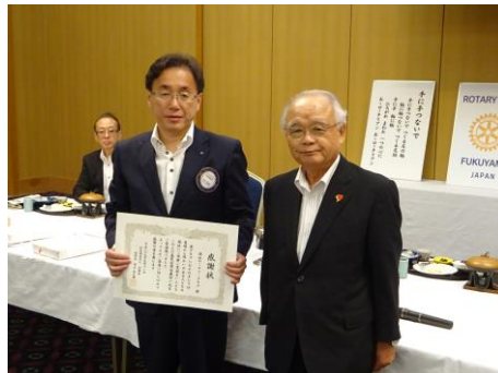
感謝状を頂きました