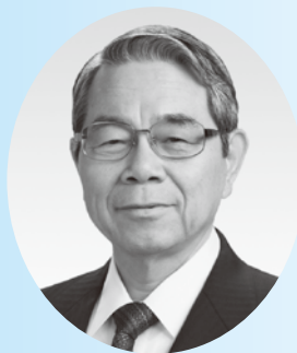
2017-18 年度 国際ロータリー第 2710 地区 ガバナー