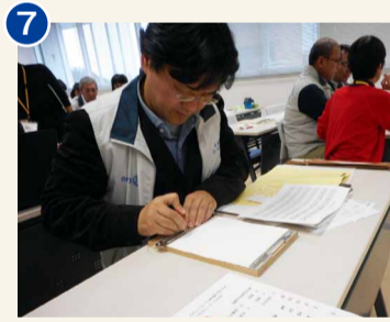
←点字カレンダーの仕上げ作業