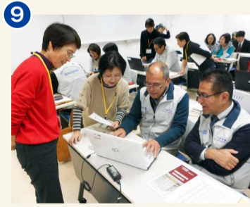
←画面を見ながら校閲