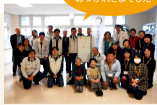
つぼみの会より、感謝状をいただきました