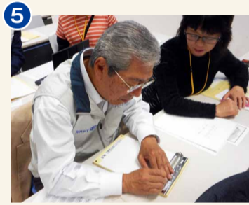
←点字板を使つての作業