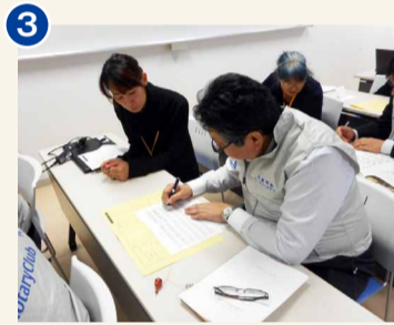
←自分の名前をまずは下書き