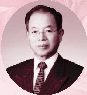
2014-15年度 国際ロータリー第2710地区 ガバナー